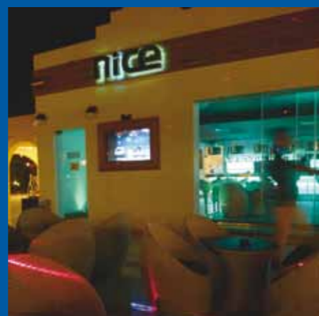
ROBINSON of nabijgelegen hotels of neem een taxi naar Hurghada. De net

geopende Marina boulevard (Nederlandse bar Nice) is een aanrader.