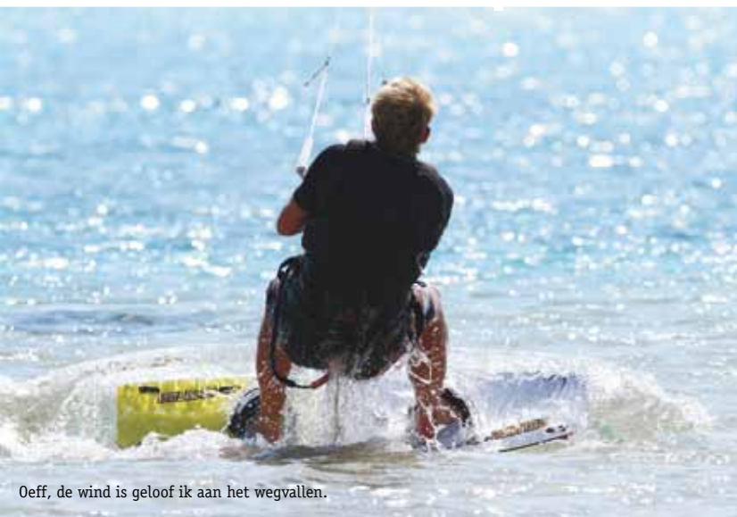
Oeff, de wind is geloof ik aan het wegvallen.