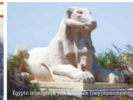
Egypte is vergeven van kolossale (nep)monumenten.