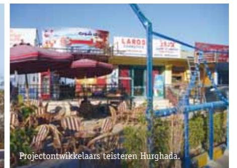
Projectontwikkelaars teisteren Hurghada.