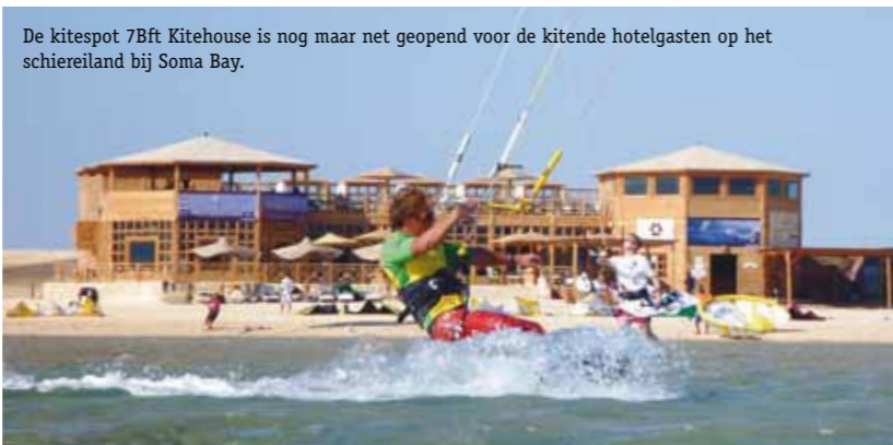
De kitespot 7Bft Kitehouse is nog maar net geopend voor de kitende hotelgasten op het schiereiland bij Soma Bay.