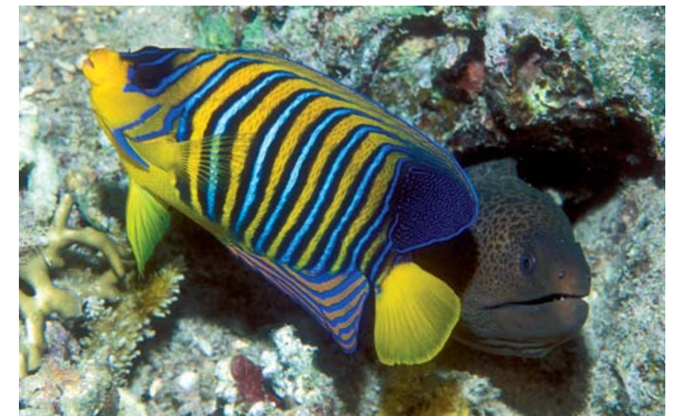
Optische Kontraste: Während der Pfauenkaiserfisch zu den auffälligsten Arten des Rifles zählt, ist die Riesemuräne trotz ihrer bis zu 2 Meter Körperlänge farblich eher unscheinbar

gels frischer Lebensmittel zumeist nur mit Fischgerichten begnügen musste, hat man heute die Qual der Wahl aus einem reichhaltigen Angebot. Nach der Rückkehr vom Tauchen gönnt man sich ein leckeres Eis im hauseigenen Eiscafé, und das italienische Restaurant „Pomodoro“ bietet ein leckeres Mittagsbuffet sowie verschiedene a la carte-Gerichte. Der schöne Innenhof wird abends zu einem hervorragenden indischen Restaurant umfunktioniert. Das „Tandoori“ ist so beliebt, das hier eine Tischreservierung auf jeden Fall von Vorteil ist. Die dem Hotel angeschlossene „Camel Bar“ ist einer der angesagtesten abendlichen Treffpunkte unter Tauchern. Sie besteht aus drei verschiedenen Bereichen: Einem klimatisierten Innenraum, einem Außenbereich mit Loungemöbeln und einer gemütlichen Dachterrasse mit Blick über das quirlige Leben der Fussgängerzone der Na'ama Bay.