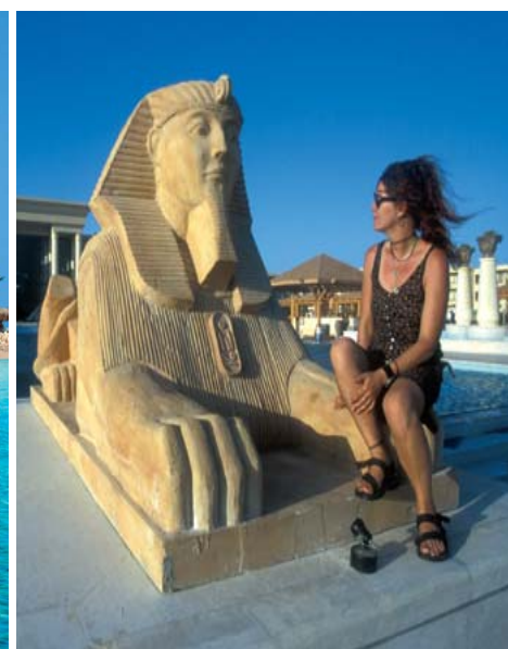
Urlaubsziel Soma Bay: Neben dem „Breakers“ Resort bietet unter anderem auch die Sheraton-Kette eine attraktive Anlage mit viel ägyptischem Flair