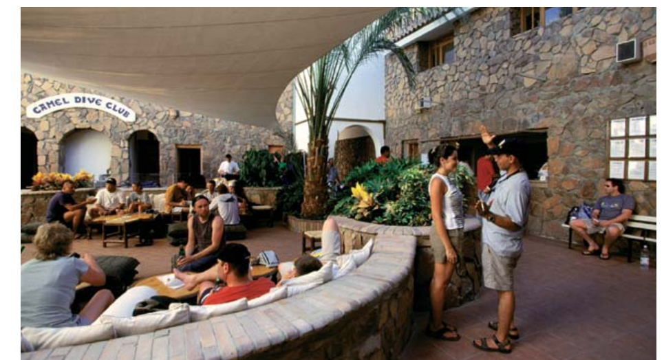
Jubiläumjahr 2011: Ein Vierteljahrhundert hat Sharm el Sheikh „Camel Dive Center“ bereits auf dem Buckel

Für Taucher wird in Sharm el Sheikh nach wie vor einiges geboten. Anders als in den 80er-Jahren ist man nun nicht mehr auf dem Landweg sondern mit komfortablen Tagesbooten zu den farbenprächtigen Korallenriffen unterwegs. Zu den Top-Spots zählt der Ras Mohammed Nationalpark, der 1983 zum geschützten Protektorat erklärt wurde. Insbesondere während der Sommermonate sammeln sich hier grosse Schulen von Barrakudas, Fledermausfischen, Barschen und Makrelen, welche natürlich auch grössere Meeressäuger anlocken. Wer jemals einer riesigen Wand von Snappern am Shark